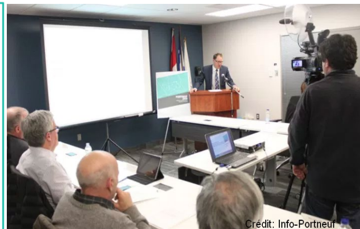
Conférence de presse (17 février 2016)