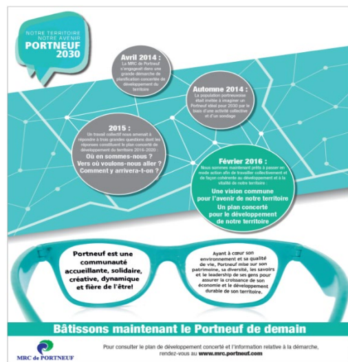
Publicité pleine page Courrier de Portneuf (février 2016)