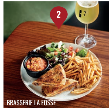
BRASSERIE LA FOSSE