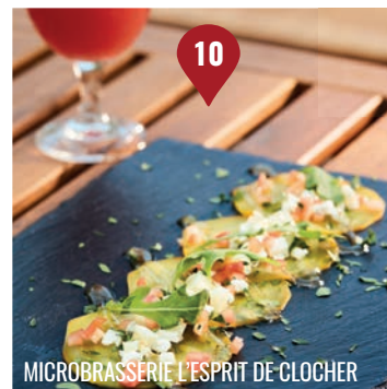
MICROBRASSERIE L'ESPRIT DE CLOCHER