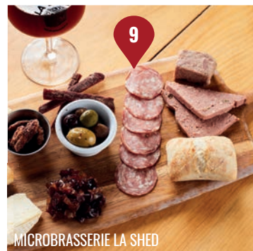
MICROBRASSERIE LA SHED