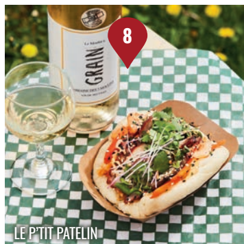
LE P'TIT PATELIN