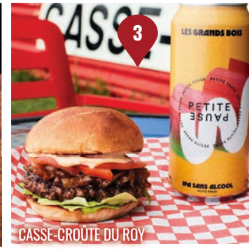
CASSE-CROÛTE DU ROY