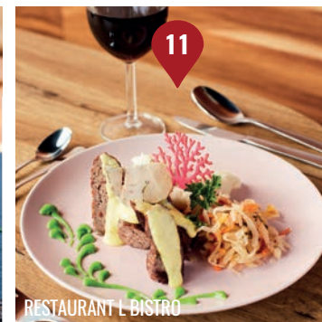
RESTAURANT L BISTRO