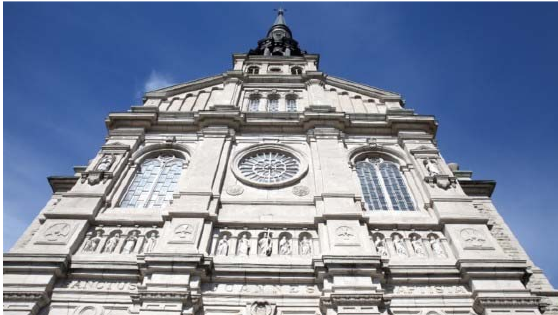
L'église Saint-Jean-Baptiste.

Quarante lieux de culte ferment chaque année au Québec depuis 2011. Cette tendance s'accélère : entre 2006 et 2010, la moyenne se situait plutôt à 31 bâtiments par année.