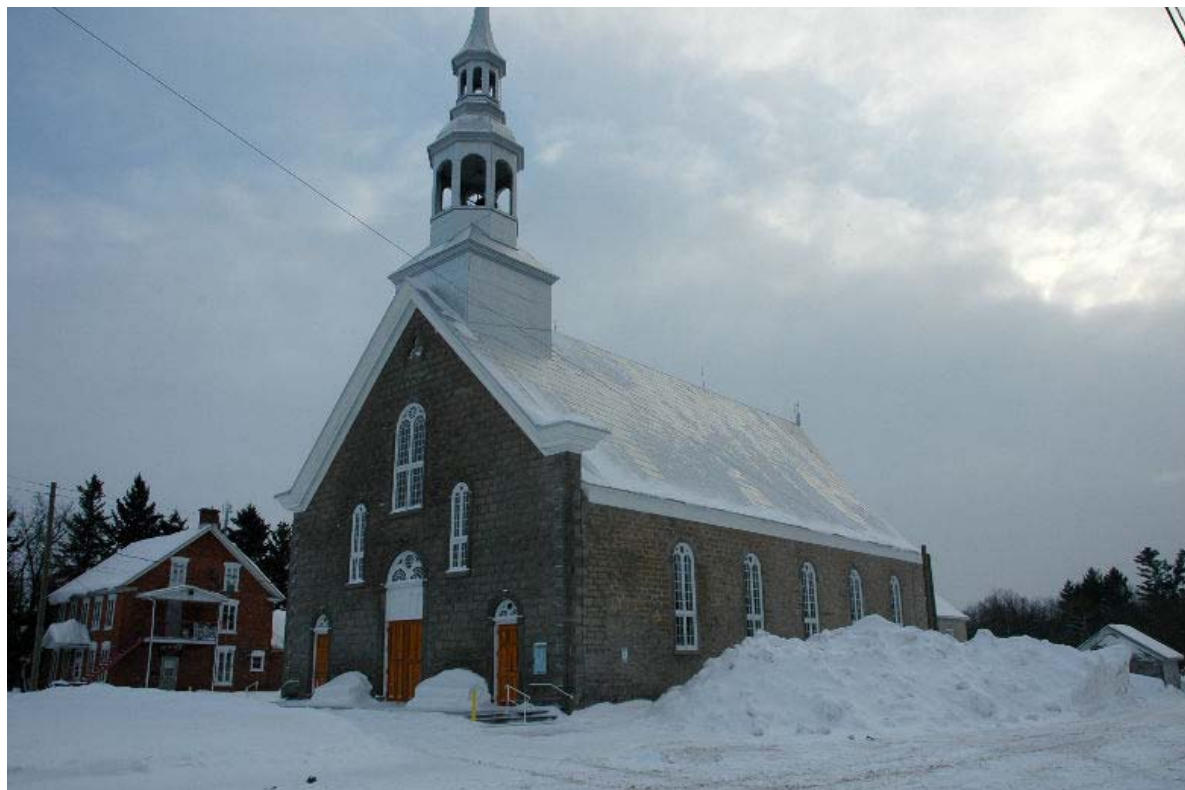
L'église de Sainte-Sophie.