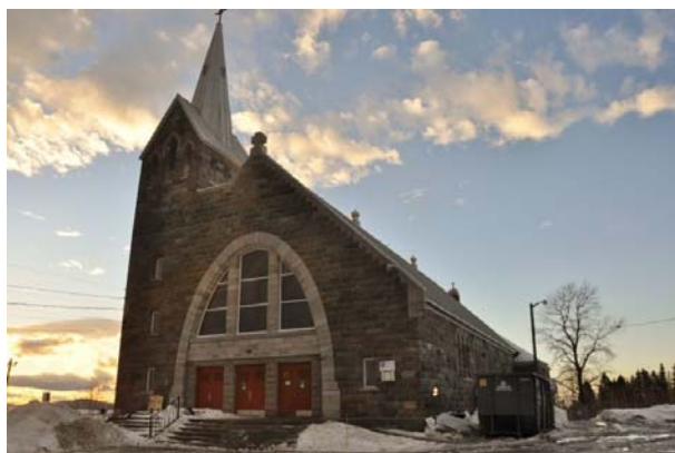
L'église de Saint-Valérien est actuellement en travaux.

Il s'agit d'un projet de 2,7 M$, pensé depuis près de six ans par les membres de la communauté et la municipalité. « Nous avons fait de nombreuses consultations publiques pour en arriver au projet final. La plus grande partie des subventions provient du Programme d'infrastructures Québec-municipalités, et du palier fédéral et de la municipalité », indique M. Savoie. La municipalité a également reçu une subvention gouvernementale pour le remplacement du chauffage au mazout en chauffage à granules de bois.