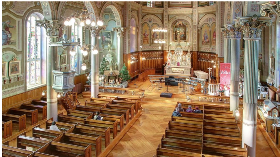
L'église Notre-Dame-de-la-Visitation de Champlain dans sa forme originale.

Publié le lundi 12 février 2018 à 13 h 52